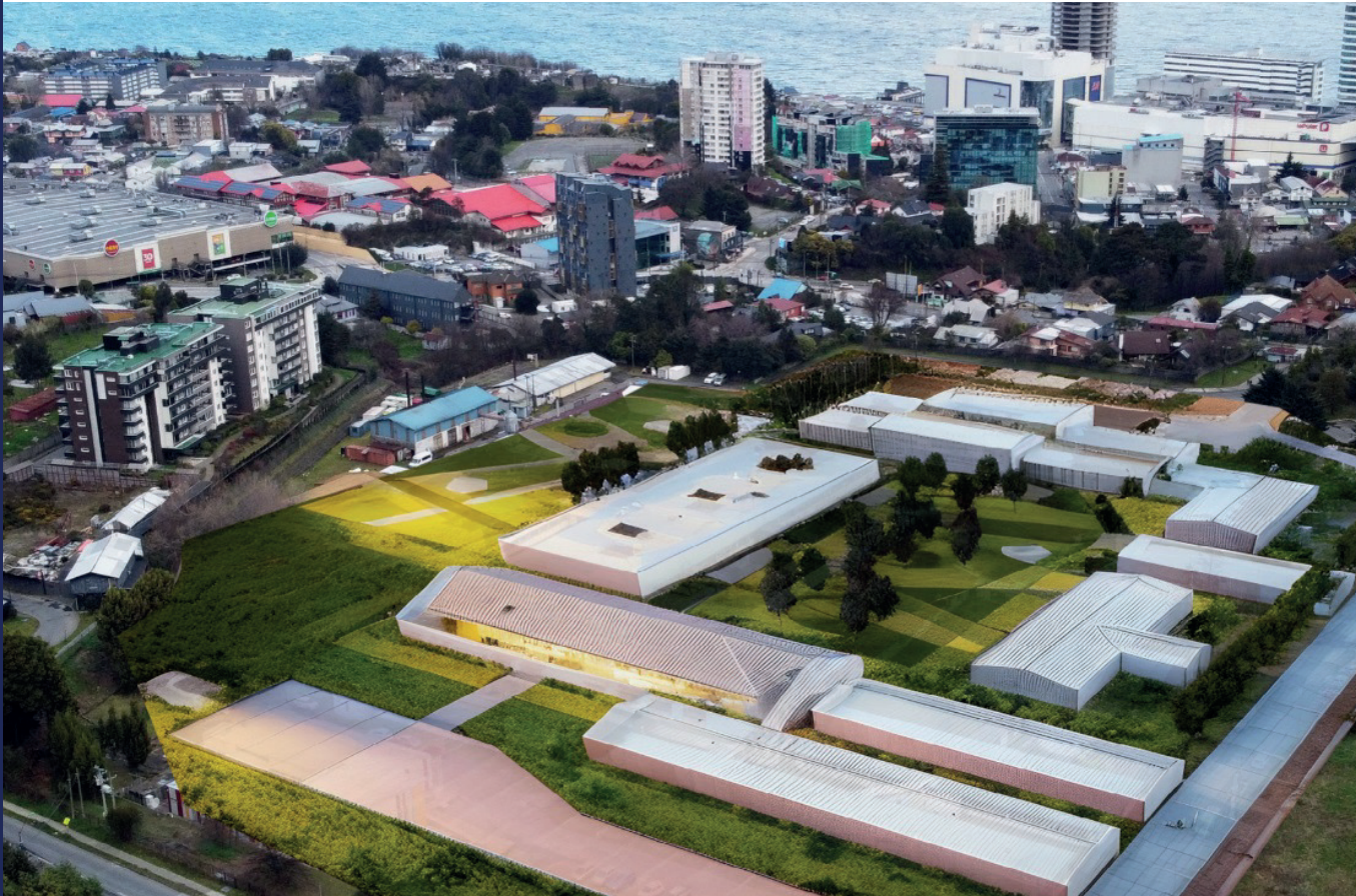
Proyección de antiguo hospital base Puerto Montt calle Seminario

Necesitamos descongestionar el sistema de salud, tanto primario (municipal) como secundario (hospitales). Debemos promover una atención más personalizada a la ciudadanía y con un seguimiento constante de las distintas necesidades de la población.